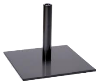
Pied platine 7,5 kg