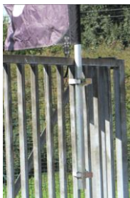
Fourreau de tribune