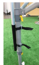
Fourreau de grille